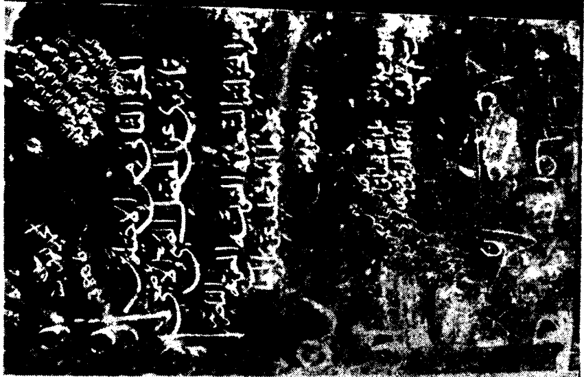
وصورة الوجه الأول من الورقة الأولى